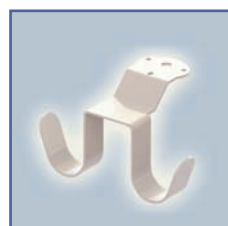
EGF 652129 Crochet de câble suspendu