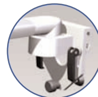
Fixation din rail