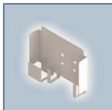
EGF 65141 Étui universel d'alimentation d'énergie