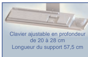
Clavier ajustable en profondeur de 20 à 28 cm Longueur du support 57,5 cm