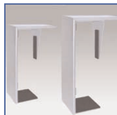
EGF 01488 Support Petit CPU Vertical