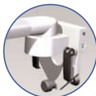
Fixation din rail