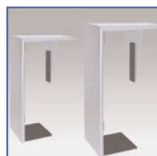
EGF 01488 Support Petit CPU Vertical