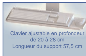
Clavier ajustable en profondeur de 20 à 28 cm Longueur du support 57,5 cm