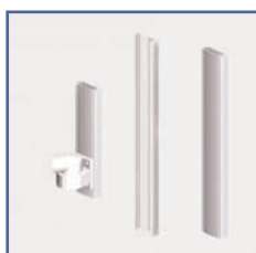
EGF 91142 Rail passage de câbles mural 120 cm