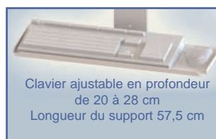
Clavier ajustable en profondeur de 20 à 28 cm Longueur du support 57,5 cm