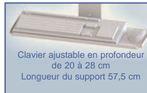
Clavier ajustable en profondeur de 20 à 28 cm Longueur du support 57,5 cm