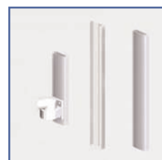
EGF 91142 Rail passage de câbles mural 120 cm