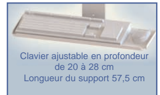
Clavier ajustable en profondeur de 20 à 28 cm Longueur du support 57,5 cm

Tous nos bras médicaux sont en conformité à la norme CE, ROHS et Médical Grade.