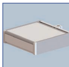
EGF 7500108 Tiroir fixation Murale