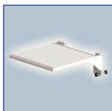
EGF 7500204 Plateau de travail fixation Murale