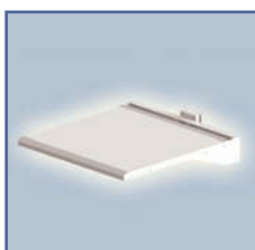
EGF 7500204 Plateau de travail fixation Murale