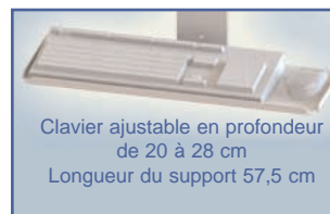
Clavier ajustable en profondeur de 20 à 28 cm Longueur du support 57,5 cm