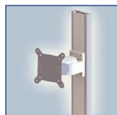
EGF 91110 Fixation Pivot court mural