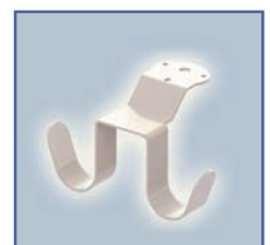
EGF 652129 Crochet de câble suspendu