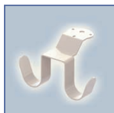
EGF 652129 Crochet de câble suspendu