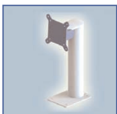
EGF 91145 Fixation Pivot court sur bureau