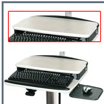
Tablette supérieur laminé avec égouttement de bord. Peut être désinfecté dans les moindres détails.