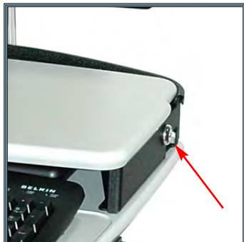
Mécanisme de sécurisation du portable avec clefs à droite et à gauche de la station.