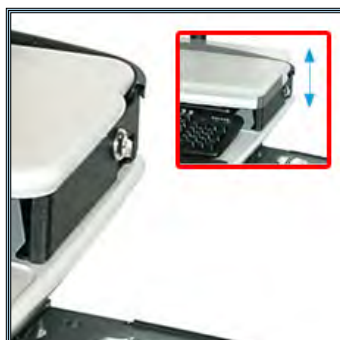
Tablette supérieure réglable sur trois niveaux de 5,08 à 6,35 cm. Permet également l'utilisation d'un ordinateur portable.