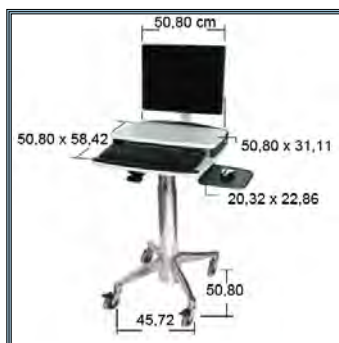
Les dimensions du chariot Laptop/Flat Panel H Class Cart.