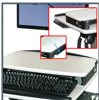
Accès à tous les connecteurs sans contrainte. L'ordinateur portable est sécurisé entre les deux plans de travail.