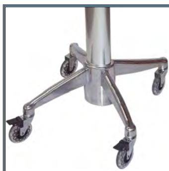
Base très compacte en aluminium anodisé pour plus de mobilité. 4 Roues antistatiques dont deux avec freins.