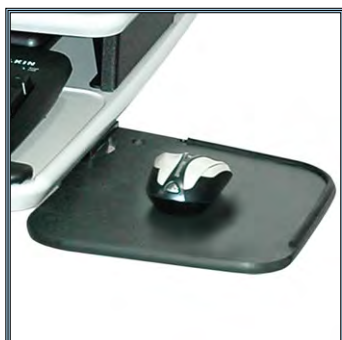
Large support pivotant pour la souris. Conçu pour faciliter le déplacement des souris optiques.