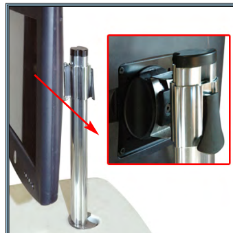
Bras écran multidirectionnel avec réglage indépendant de la hauteur. Conforme à la norme de montage Vesa 75/100 mm.