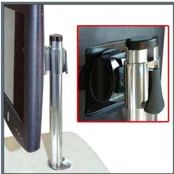
Bras écran multidirectionnel avec réglage indépendant de la hauteur. Conforme à la norme de montage Vesa 75/100 mm.