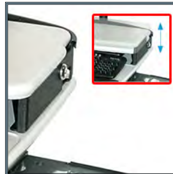
Tablette supérieure réglable sur trois niveaux de 5,08 à 6,35 cm. Permet également l'utilisation d'un ordinateur portable.