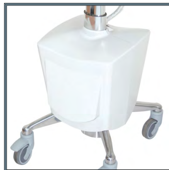
Base alimentée très compacte en aluminium anodisé pour plus de mobilité. 4 Roues antistatiques dont deux avec freins.