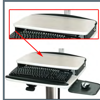
Tablette supérieure laminée avec égouttement de bord. Peut être désinfectée dans les moindres détails.