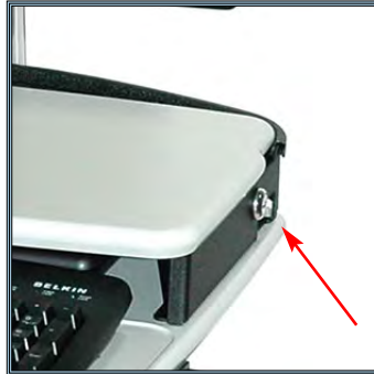
Mécanisme de sécurisation du portable avec clefs à droite et à gauche de la station.