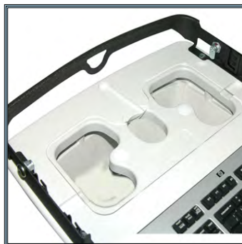
Accès à tous les connecteurs sans contrainte.