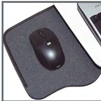
Large support pivotant pour la souris. Conçu pour faciliter le déplacement des souris optiques.