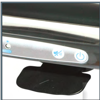
Ajustement de la hauteur par simple pression sur la pédale à main en dessous du plan de travail. Poignée de transport avec incorporation de l'interface d'utilisation de la batterie.