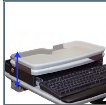
Plan de travail supérieur réglable sur trois niveaux de hauteur, de 5,08 à 6,35 cm. Aucun outils nécessaires pour le réglage. Permet un accès facile aux commandes.