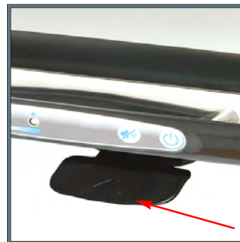
Ajustement de la hauteur par simple pression sur la pédale à main en dessous du plan de travail.