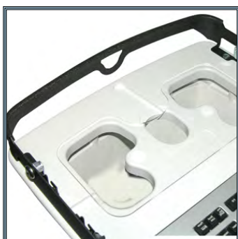
Accès arrière à tous les connecteurs de l'ordinateur portable. Protection anti-choc arrière pour l'écran du portable, évite à l'écran le basculement.