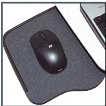
Large support pivotant très robuste pour la souris, repose poignet sur toute la largeur du plan de travail.