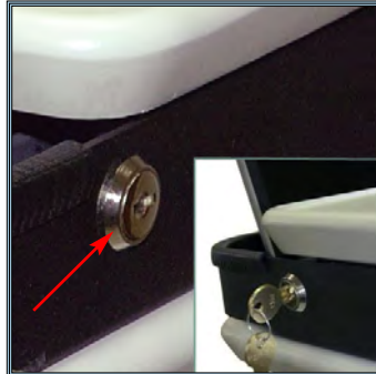
Mécanisme de sécurisation du portable avec clefs. (anti vol). Une serrure à droite et une serrure à gauche.