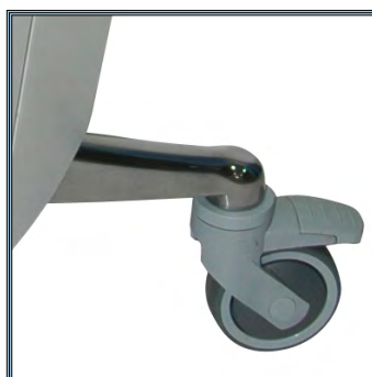
Roues antistatiques à haute précision de mobilité, 100 mm. Deux roues équipées de frein.