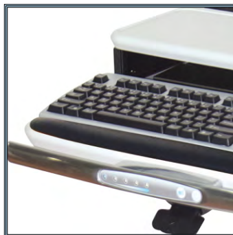
Poignée de transport avec incorporation de l'interface d'utilisation de la batterie.