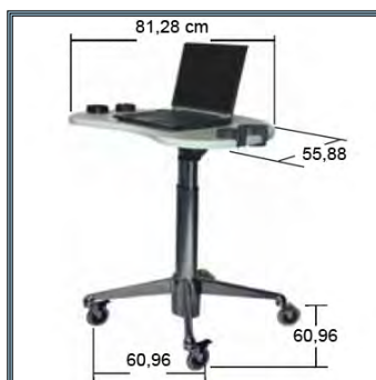
Les dimensions du chariot Laptop Ultra sond Cart.