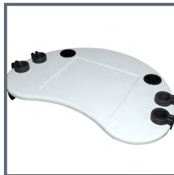
Large surface de travail pouvant être désinfectée dans les moindres détails. La partie centrale accueille l'ordinateur portable.