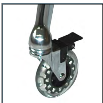
Roues antistatiques à haute précision de mobilité, 100 mm. Deux roues équipées de frein.