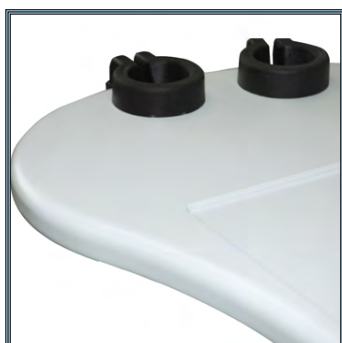
Plan de travail de forme arrondie et postformée pour accueillir l'ordinateur portable.