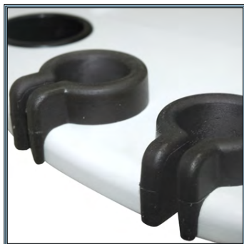
Emboîtement de sonde (2 par station).