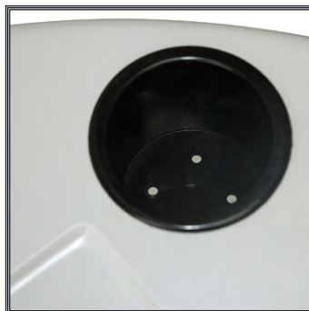
Boîtier gel trasceptic (2 par station).