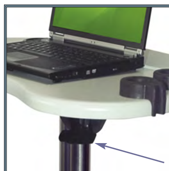
Ajustement de la hauteur par simple pression sur la pédale à main en dessous du plan de travail.