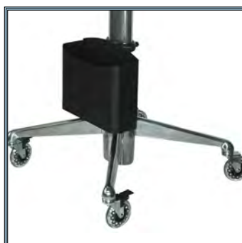
Large base en aluminium anodisé permettant la désinfection totale.