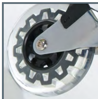
Désinfection des roues sans contraintes.