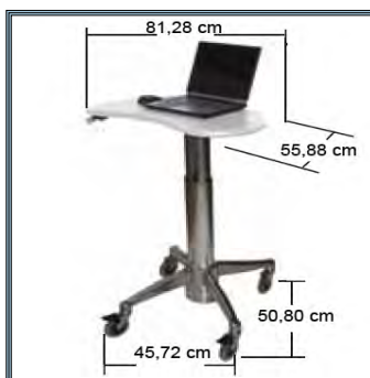
Les dimensions du chariot Laptop Kidney Cart.