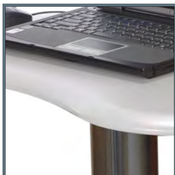
Plan de travail postformé de forme arrondie pouvant être désinfectée dans les moindres détails.