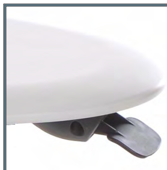
Ajustement de la hauteur par simple pression sur la pédale à main en dessous du plan de travail.