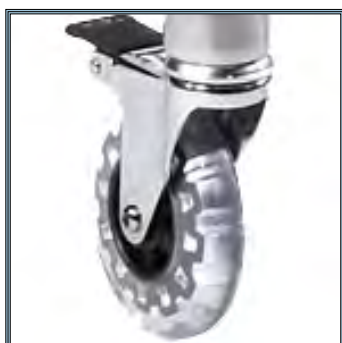
Roues antistatiques à haute précision de mobilité, 100 mm. Deux roues équipées de frein.