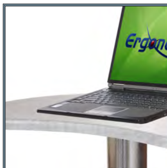
Chant frontal du plan de travail arrondi pour un meilleur confort de travail.