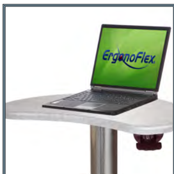
Large plan de travail polyvalent