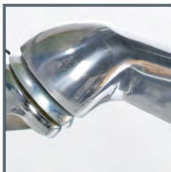
Piètements robustes en aluminium anodisé.