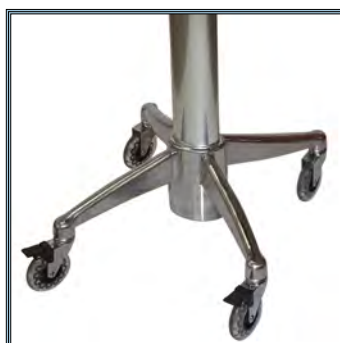
Base design très compacte de 45,72 x 50,80 cm pour un encombrement réduit.