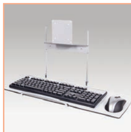
Référence: EGF 51582 Plateau universel clavier et souris bras support pour écran