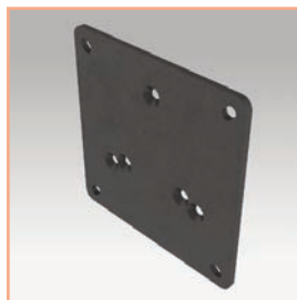
Référence: EGF 53983 Plaque de fixation VESA 75 x 75 mm