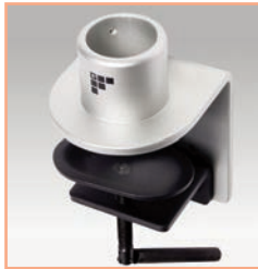
Référence: EGF 53862 Pince serre-joint de bureau pour tube de support