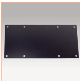
Référence: EGF 51043 Adaptateur universel VESA 100 x 100 - 200 x 100