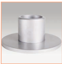
Référence: EGF 53962 Socle de fixation au travers du bureau pour tube de support