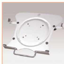
Référence: EGF 51072 Support ordinateur portable universel pour bras écran