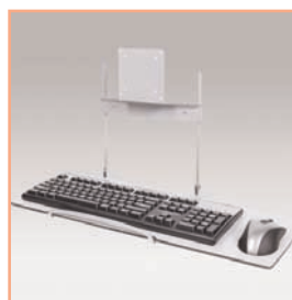
Référence: EGF 51582 Plateau universel clavier et souris bras support pour écran