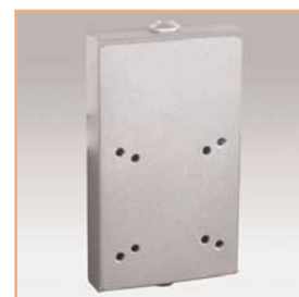
Référence: EGF 53072 Adaptateur support mural universel pour panneaux rainurés