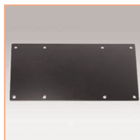
Référence: EGF 51043 Adaptateur universel VESA 100 x 100 - 200 x 100