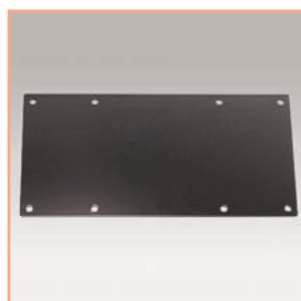
Référence: EGF 51043 Adaptateur universel VESA 100 x 100 - 200 x 100