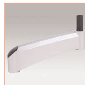
Référence: EGF 53042 Extension simple 18 cm