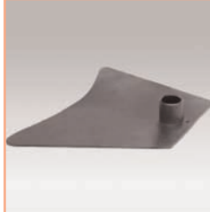
Référence: EGF 53901 Socle Classique pour fixation tube