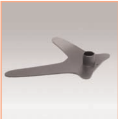
Référence: EGF 53903 Socle Design pour fixation tube