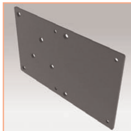
Référence: EGF 51053 Adaptateur universel VESA 100 x 100 excentré à 80 mm