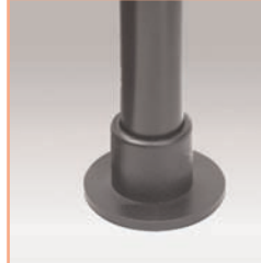
Référence: EGF 53963 Socle de fixation au travers du bureau pour tube de support