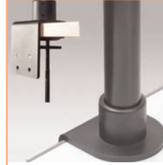
Référence: EGF 53863 Pince serre-joint de bureau pour tube de support