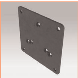
Référence: EGF 53983 Plaque de fixation VESA 75 x 75 mm