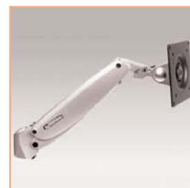
Référence: EGF 57022 Bras support à vérin à gaz mécanisme parallèle