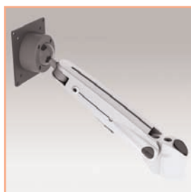
Référence: EGF 53012 Bras support à vérin à gaz