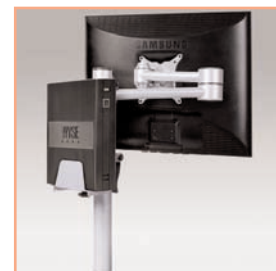
Référence: EGF 52402 Support modulaire pour client léger