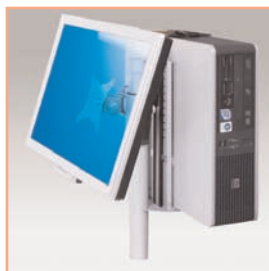
Référence: EGF 52412 Support modulaire pour mini PC