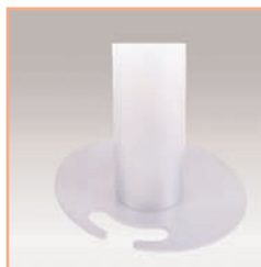
Référence: EGF 52952 Socle de fixation modulaire au travers du bureau