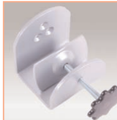
Référence: EGF 52922 Pince serre-joint de bureau modulaire